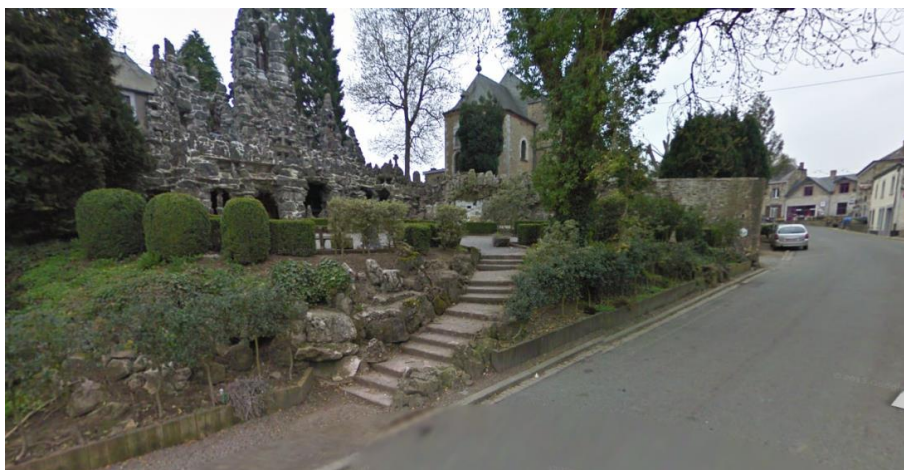
Escalier donnant accès à la grotte et à l'OTA