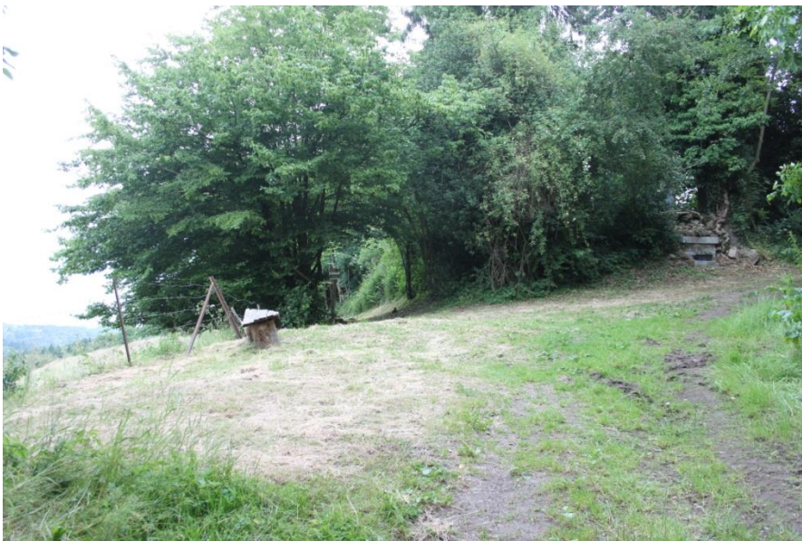
Emplacement envisagé de l'aire pique-nique/barbecue