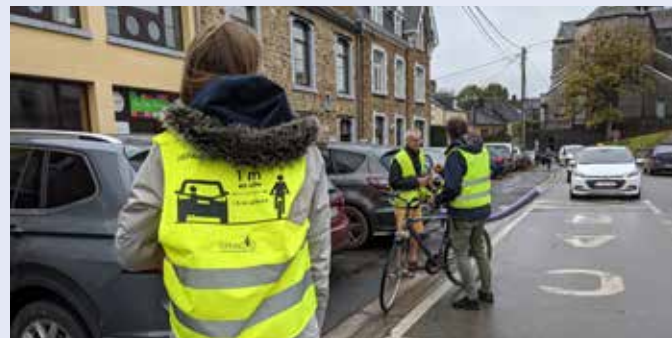
Action de sensibilisation du 19 octobre

Le Gracq Assesse, motivé par la promotion du vélo au quotidien s'étoffe petit à petit de nouveaux sympathisants. N'hésitez pas à les rejoindre. Le groupe est accessible à tous. Il n'est pas indispensable pour cela d'être membre du Gracq même si c'est un plus : la cotisation permet de bénéficier d'une assurance protection juridique en cas d'accident à vélo pour tous les membres du ménage cotisant. La revue trimestrielle, le Gracq-Mag vous est également envoyée.