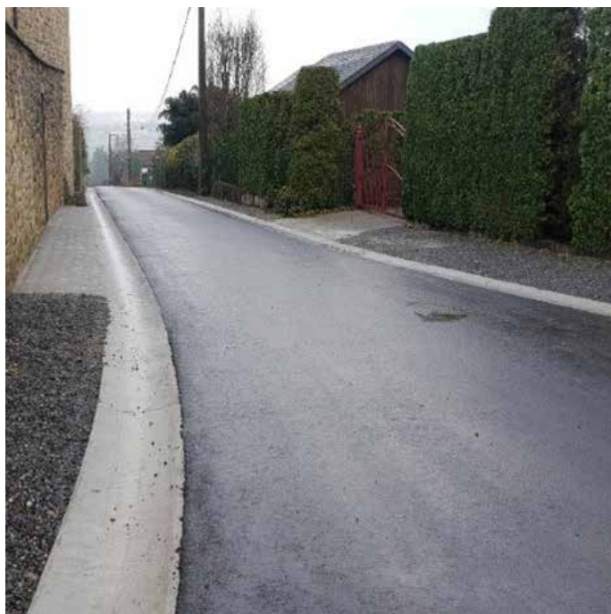
Sart-Bernard, rue Piot