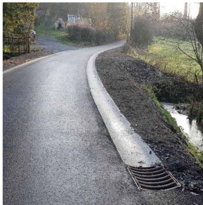
Florée, rue de Skeuvre

Une information plus précise sera prévue prochainement pour les riverains.